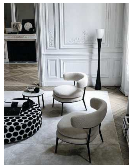
Ci-dessous, des fauteuils de la collection « Archive ».