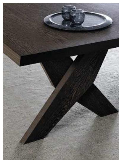
Ci-dessus et ci-contre, des pièces des nouvelles collections Maxalto « Tesaurus », « Ares » et « Caratos ».