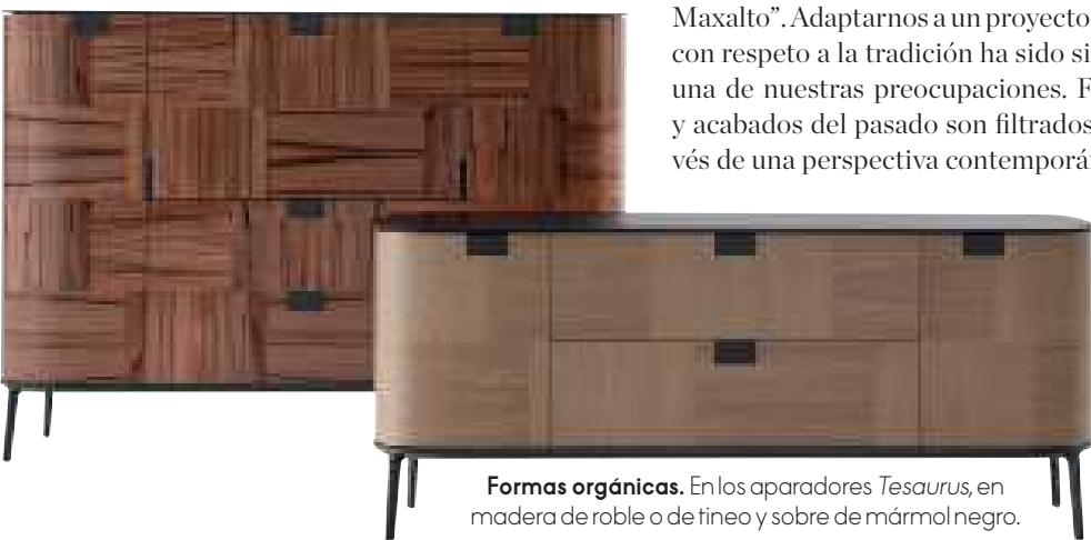
Formas orgánicas. En los aparadores Tesaurus , en madera de roble o de tinoe y sobre de mármol negro.

Son parte de una colección que apunta a la gente que quiere “echar raíces”, que es lo opuesto a la “temporalidad”. Los objetos de alta calidad permanecen en el tiempo. •